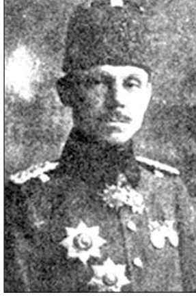
Süleyman Numan Paşa