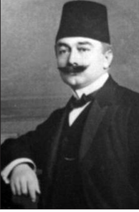
Esat Işık Paşa