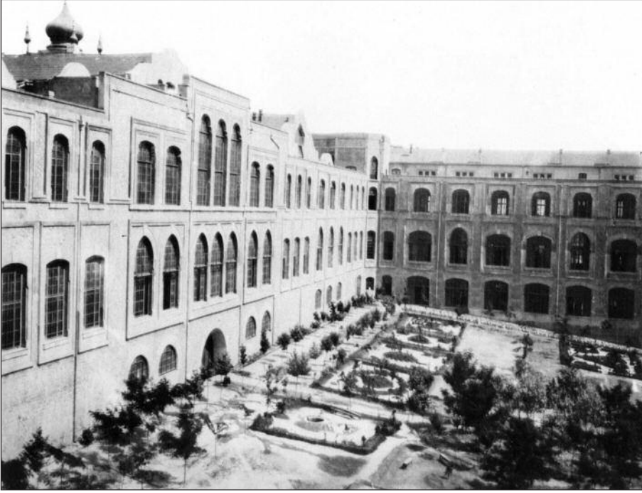
Mekteb-i Tıbbiye'nin Bahçesi