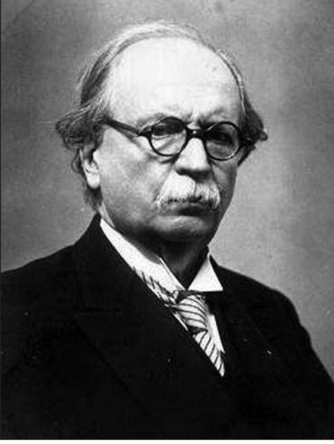
Besim Ömer Akalın

rülfünun Divanı'nın ortak kararı sonrası, Darülfünun'un açılacağı haberi basında yer aldı. Açıklama şöyleydi; " Darülfünun daha fazla kapalı olarak kalmasının bir ve hatta iki ders devresinin kayıp olmasına neden olacağını dikkate alan darülfünun divanı, talebenin menfaati namına Darülfünun bütün şubelerinin 20 Mayıs Cumartesi günü açılmasına karar vermiş. Gerek devam etmeyenler gerek tedarisat kurallarının ihlal edenler hakkında nizamname ve talimatname hükümlerinin tatbiki tabii olduğu ilan olunur " 94 . Açılış günü çıkması muhtemel olan olaylar için Darülfünun Emaneti Hükümet'ten kolluk kuvvetleri istedi, derslere devam etmek isteyen öğrencilerin sınıflarına sağ salim girmeleri planlandı 95 .