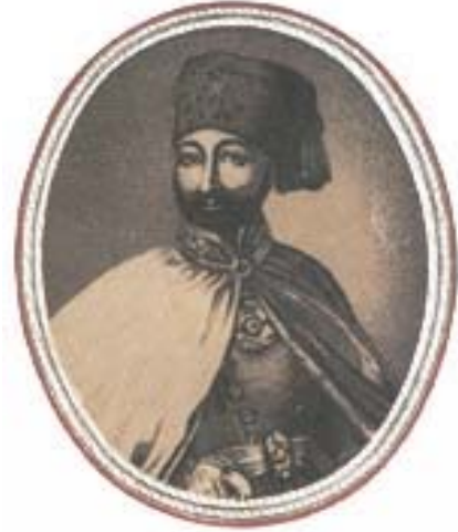
Resim V-1. Yenilikçi Padişah, Sultan II Mahmud (1785-1839).

Çağdaş tıp eğitiminin başlangıcı ve Türkiye’de yenileşme çabaları, yenilikçi ve batı yanlısı bir kimse olan Sultan II. Mahmud (Resim V-1) Dönemi’ne dayanmaktadır. Sultan II. Mahmud’un en büyük amacı, “devleti Batı tarzını örnek alarak yeni bir düzene oturtmaktır.” Kendi zama-