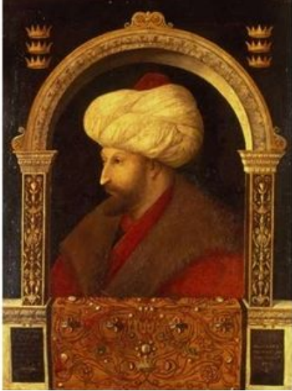
Resim IV-1. Venedikli Gentile Bellini (1429-1507)'nin, 1480 yılında, İstanbul'da yapmış olduğu portre.

Fatih Sultan Mehmet (1432 - 1481) (Resim IV-1), İstanbul'u alarak Orta Çağ'ı kapatıp, Yeniçağ'ı açmış, ayrıca, Aya-sofya ve Zeyrek'te Fatih (Ayasofya) Medresesi'ni açarak, ilk İstanbul Üniversitesi'nin temelini atmıştır (1453). İspanya ve İtalya'dan kovulan bilim adamlarına (çoğu Yahudi) kucak açarak, ayrıca Avrupa'da Rönesans'a da katkıda bulunmuştur (1-3).