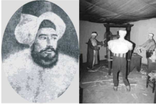
Resim IV-2. İbrahim Mütefferika (1670-1745). Resim IV-3. İbrahim Mütefferika'nın basımevi (1727)

İlk basımevi 1438 yılında Alman Johannes Gutenberg (1398-1468) tarafından bulundu. J. Gutenberg’in bu buluşunu Williom Caxton İngiltere’ye getirdi. Bu yöntem daha sonra Amerika’daki İngiliz kolonilerine götürüldü.