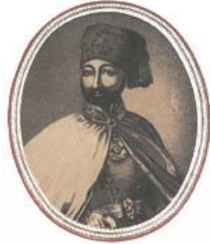
Resim V-1. Yenilikçi Padişah, Sultan II Mahmud (1785-1839).

Çağdaş tıp eğitiminin başlangıcı ve Türkiye’de yenileşme çabaları, yenilikçi ve batı yanlısı bir kimse olan Sultan II. Mahmud (Resim V-1) Dönemi’ne dayanmaktadır. Sultan II. Mahmud’un en büyük amacı, “devleti Batı tarzını örnek alarak yeni bir düzene oturtmaktır.” Kendi zama-