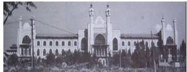
Resim VII-3. Mekteb-i Tıbbiye-i Şahane (1909).