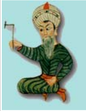
Tablo III-I. Amasya İli Valiliği Web sayfasında Şerefeddin Sabuncuoğlu (5).