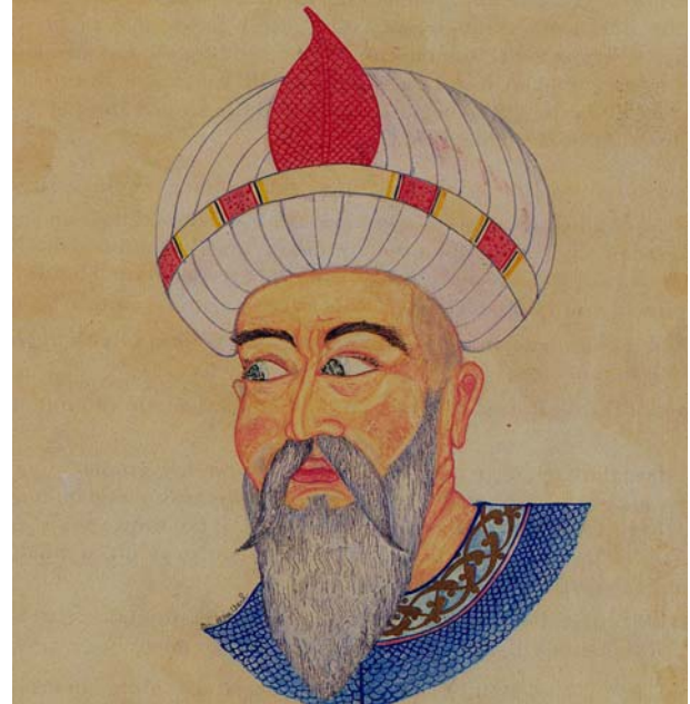
Resim III-1. Şerafeddin Sabuncuoğlu (1385 -1470 Amasya).