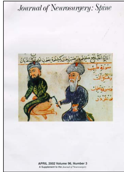
Tablo III-II. Şerafettin Sabuncuoğlu'nun kitabındaki spinal cerrahi konusundaki çalışmalarını işleyen bir yaygın (6).

J Neurosurg (Spine 3) 96:352-356, 2002 History of spinal disorders and Cerrahiyetül Haniye (Imperial Surgery)