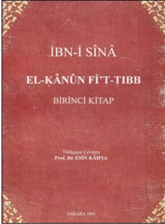
Resim II.3. El-Kanun Fi't-Tıbb (Canon, Canon Medicinea).